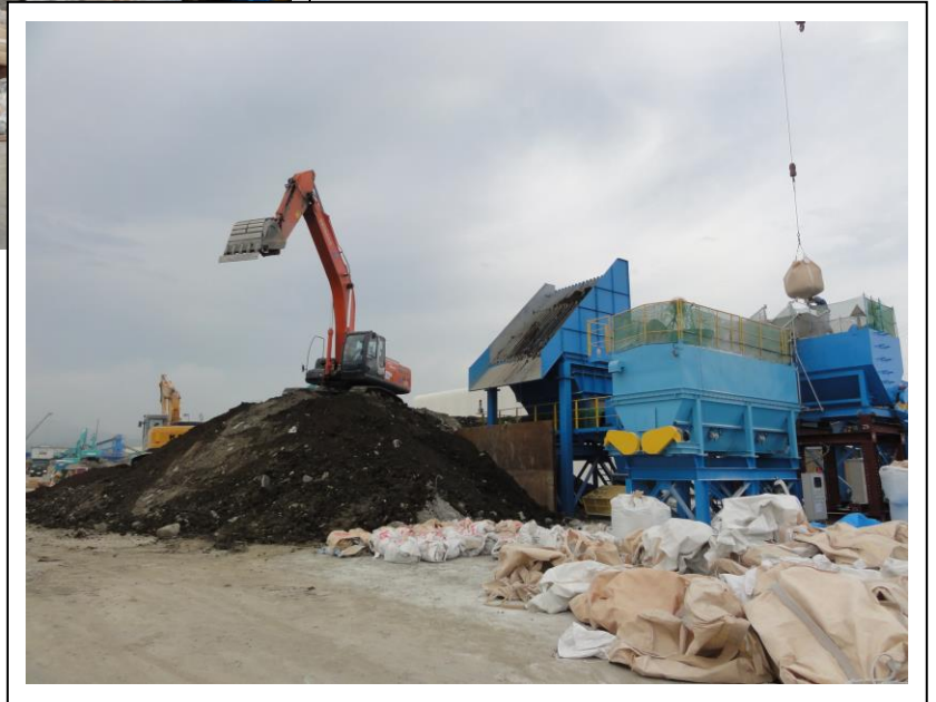
④ 津波堆積物グリズリへ投入