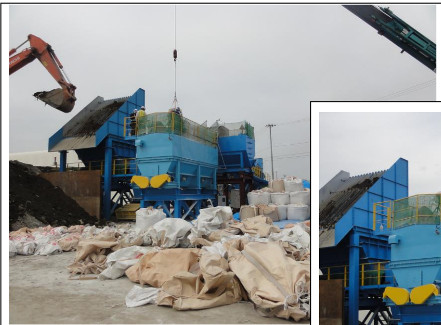
⑤ 不溶化剤ホッパーへ投入