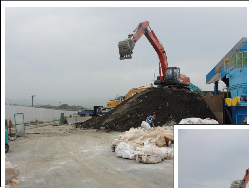
③ スケルトンバケット作業後の津波堆積物