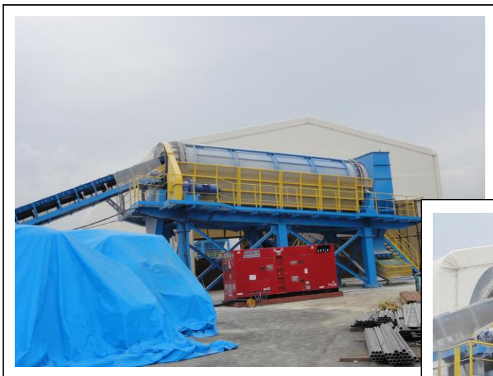
⑨ 大型混合機（2,000 t /日/台）