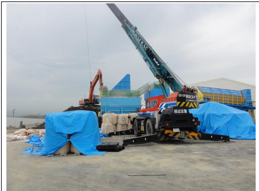
⑦ 大型クレーンで資材の吊上げ（不溶化剤）